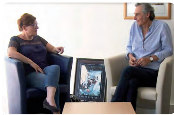
Un travail d'équipe

La personne accueillie est toujours considérée comme hospitalisée et reste sous la responsabilité du Centre Hospitalier.